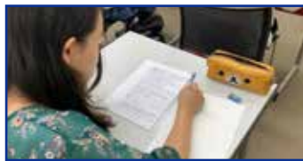
卒業に必要な学習への不安を解消