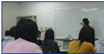
通信制のシステムも含めECCの特長をご説明