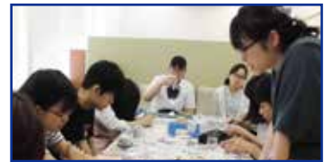
授業体験や在籍生トーク等のプログラム