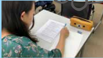
卒業に必要な学習への不安を解消