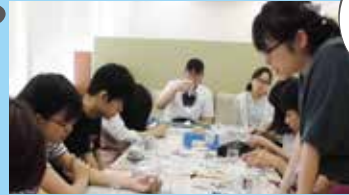
授業体験や在籍生トーク等のプログラム