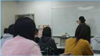
通信制のシステムも含めECCの特長をご説明